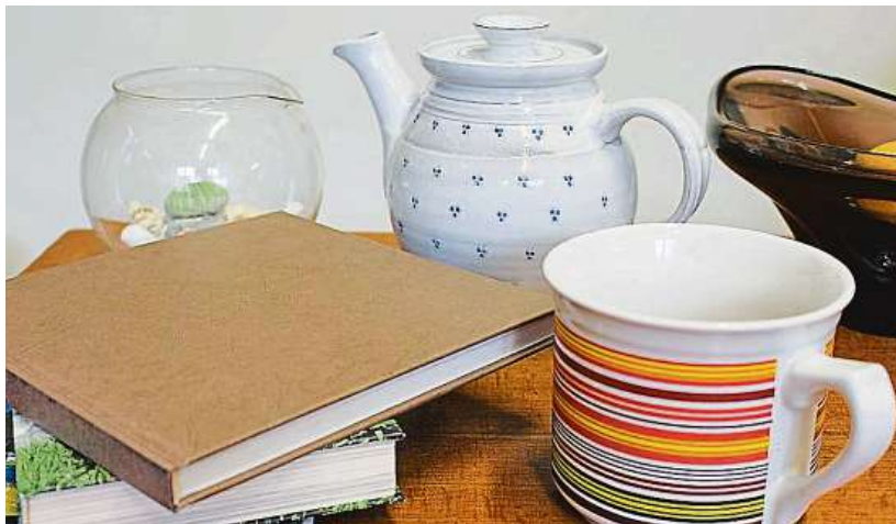
KNIHY I VÁZY LIDÉ MOHOU V RE-USE CENTRU BEZÚPLATNĚ ODEVZDÁVAT DROBNÝ NÁBYTEK, ZAŘÍZENÍ A VYBAVENÍ DOMÁCNOSTÍ, OBRAZY, RÁMY, VÁZY, CD, DVD NEBO KNIHY.

„Proces EIA hodnotí a dává doporučení především k tomu, za jakých podmínek a zda vůbec je možné projekt a stavbu realizovat, aniž by došlo k nežádoucímu narušení životního prostředí. Území budoucího komplexu je zorganizováno tak, aby zde mohly samostatně existovat i spolupracovat tři různé subjekty. Tedy sběrný dvůr, re-use centrum a kom-