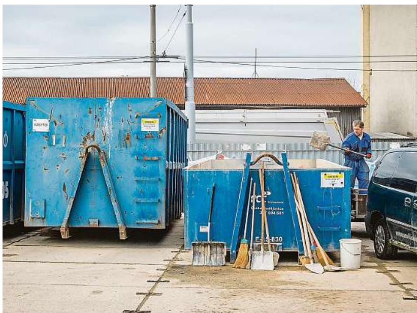
TISÍCE TUN OBČANÉ ROČNĚ ODEVZDAJÍ V AREÁLU V DOLNÍ 7 600 TUN ODPADŮ. NA SBĚRNÉM DVORĚ V PLYNÁRENSKÉ (NA SNÍMKU) JE TO 4 300 TUN A NA ŠVÁBOVĚ HRÁDKU 3 800 TUN.

Sběrný dvůr v Plané se má veřejnosti otevřít na jaře. I společnost FCC, která všechny čtyři dvory ve městě provozuje,