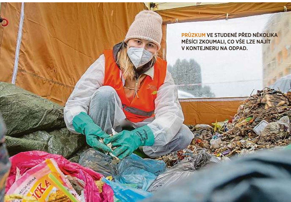
PRŮZKUM VE STUDENÉ PŘED NĚKOLIKA MĚSÍCI ZKOUMALI, CO VŠE LZE NAJÍT V KONTEJNERU NA ODPAD.

Jako snahu o lepší hospodaření považuje Škoda i zakoupení lisu na papír. „Lis mění kartony do obchodovatelného balíku, který má přibližně 500 kilo. Poté přijede firma a papír od nás vykoupí. Už tedy neplatíme jen peníze za odvoz, ale naopak někdo platí i nám. Naposledy jsme měli nachystaných třináct balíků,“ cení si. I takto mohou obec snížovat svoje náklady. A podle vedení obce se budou muset podobnou cestou vydat i ostatní obce a města.