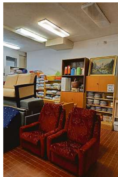
NENÍ TO ODPAD POSLÁNÍM NÁBYTKOVÉ BANKY JE SNAHA O VYUŽITÍ NÁBYTKU A VYBAVENÍ PRO DOMÁCNOST. TO VŠE BY JINAK SKONČILO JAKO ODPAD.

jejich počet narůstá. Když jsme začínali, rozjelo se to z nuly na sto za čtrnáct dní. Začínali jsme se skladem o 140 m 2 , ten byl během dvou týdnů plný. A než jsme se zorientovali, byl konec dubna a my měli za sebou prvních 25 tun. A v tomhle duchu probíhal celý rok,“ vzpomínala ředitelka.