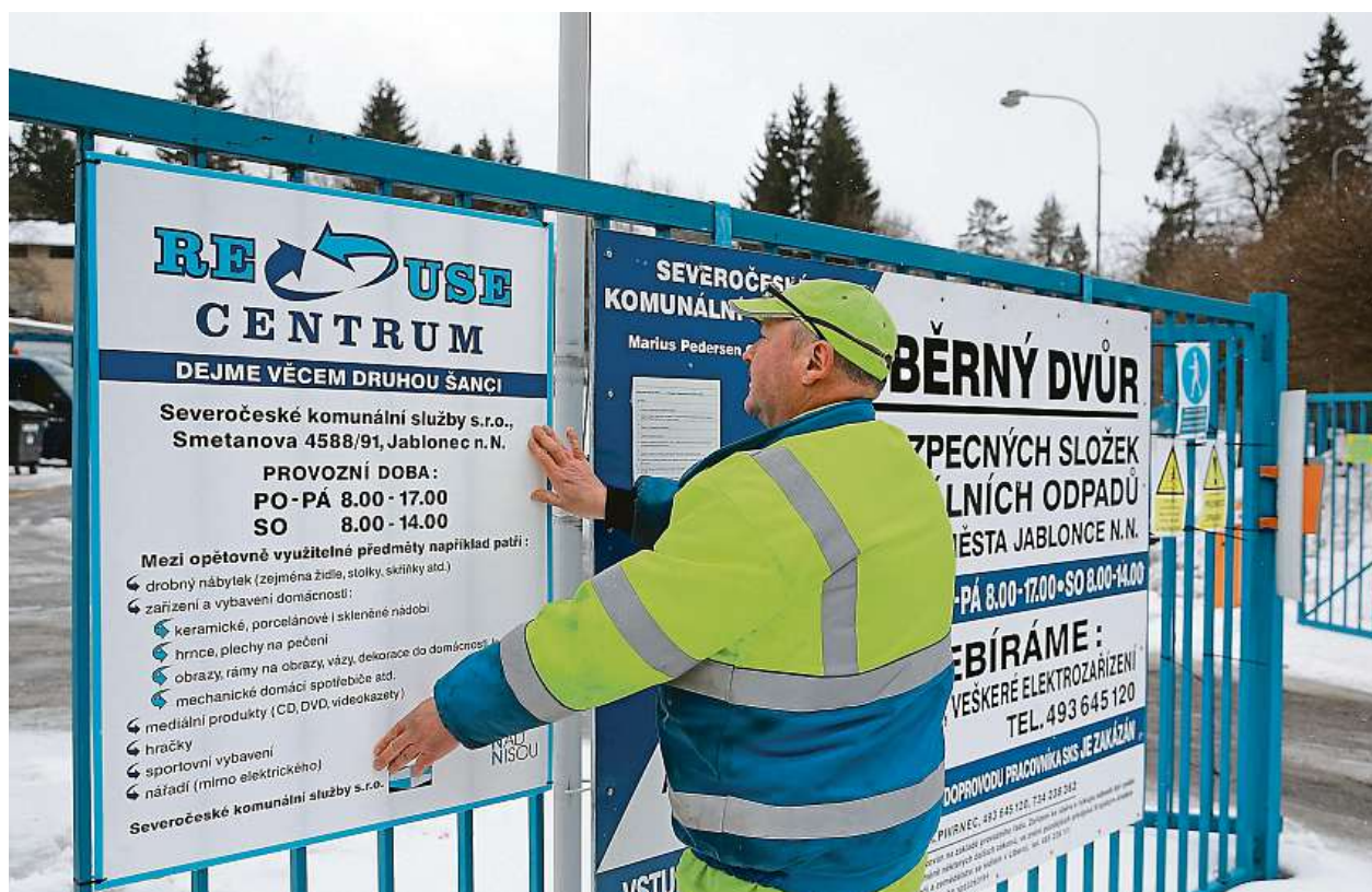
RE-USE CENTRUM FUNGUJE V JABLONCI NAD NISOU OD NOVÉHO ROKU NA SBĚRNÉM DVOŘE VE SMETANOVĚ ULICI.

Drobné nepotřebné věci z domácností mohou lidé odnést do re-use center. Jde o jakési bazary, v nichž mohou zájemci levně nakoupit.